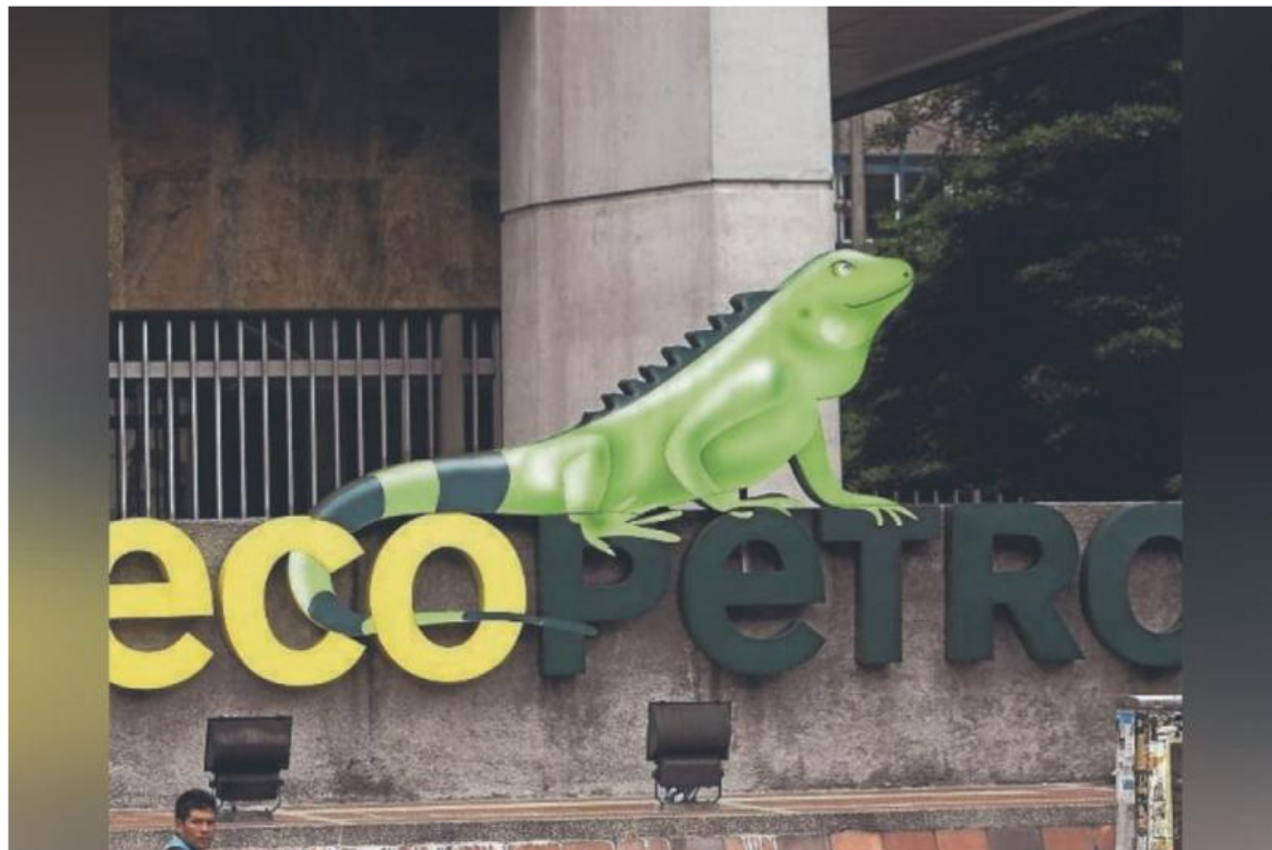
Logo de la petrolera estatal colombiana Ecopetrol .