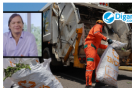
Biota dice adiós, será VEOLIA quien recoja ahora... 2022-09-13