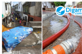
¿Por qué el agua no tuvo por dónde... 2022-09-14