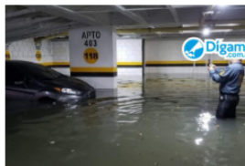
Aguacero en Barrancabermeja, dejó vías inundadas, casas colapsadas... 2022-09-13