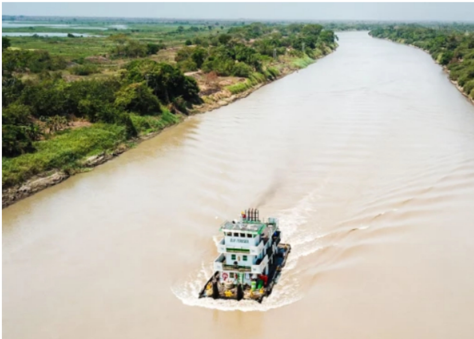
Canal del Dique Fondo Adaptación.

La comunidad bloqueó el paso de embarcaciones para llamar la atención del gobierno y exigir obras de prevención ante el riesgo de inundaciones.