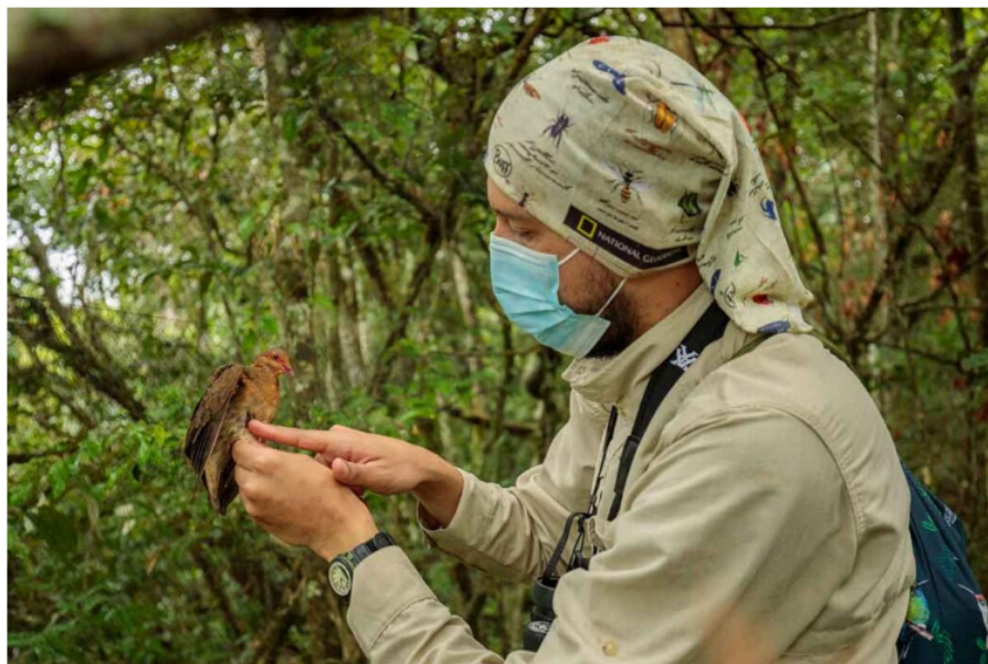
Ecoreserva La Danta, hogar de 612 especies de fauna y flora de la altillanura

En flora se estudiaron plantas como la flor de mayo (scuticaria steelei), conocida en muy pocas localidades de nuestro país, una de ellas la ecoreserva La Danta siendo la única de su especie para la región de la Orinoquía colombiana y la tercera en el país.