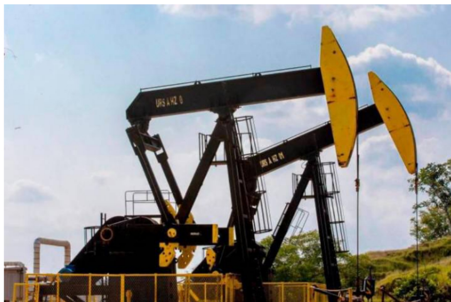
El juzgado ordenó la suspensión de la licencia ambiental de los pilotos Kalé y Platero, la cual fue autorizada el pasado 28 de marzo por la Anla.

Como operador de los proyectos piloto, Ecopetrol solicitó a la ANH la suspensión de los contratos CEPI Kalé y Platero por un plazo de 90 días.