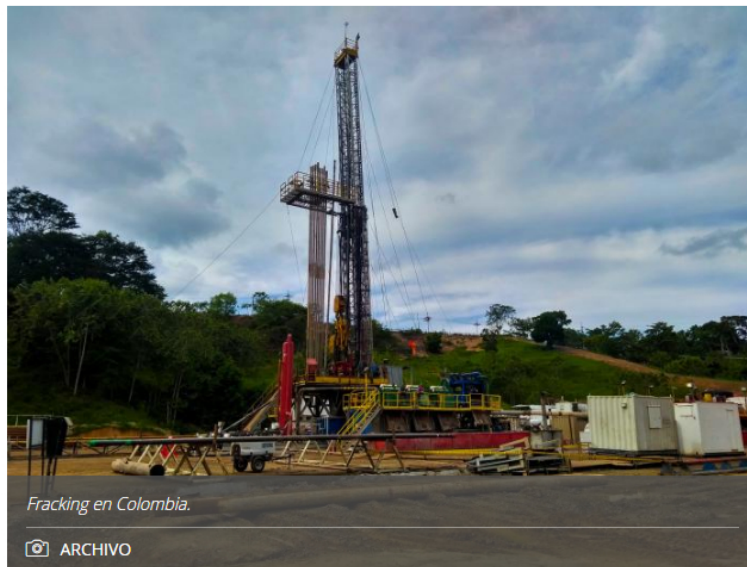
Fracking en Colombia.

Con estos 90 días la compañía busca abrir un compás de espera mientras se determina el futuro de los pilotos. La solicitud se presentó a la ANH.