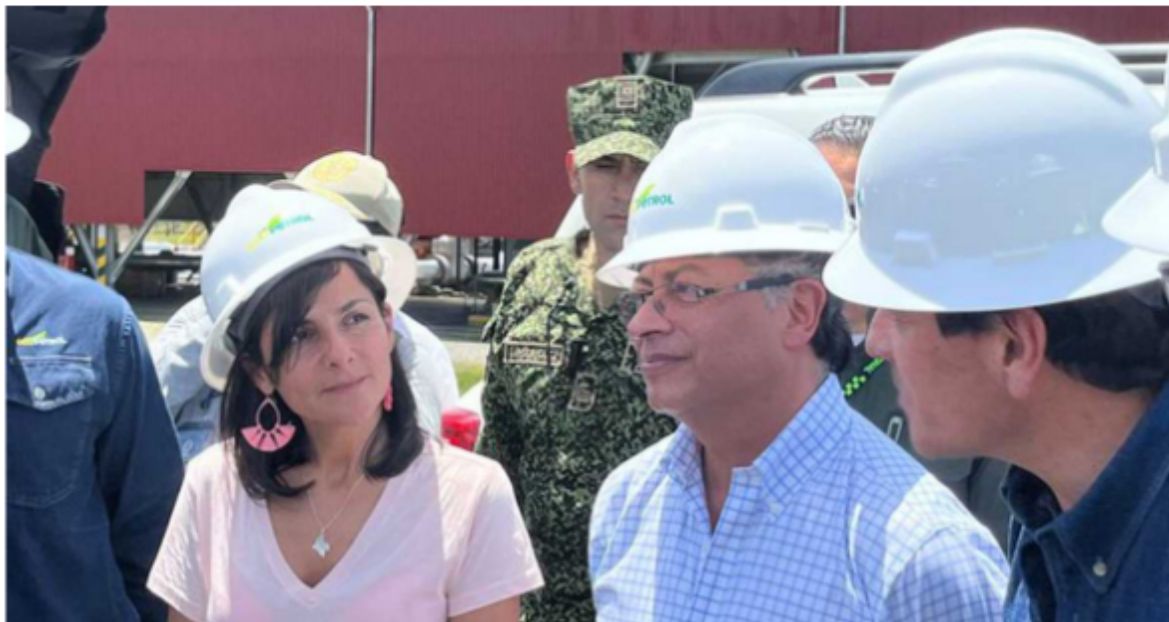
El presidente Petro, ministro de minas y presidente de Ecopetrol en los parques solares de esa empresa en el Meta, Foto: Presidencia

El debate sobre la transición energética se ha ido aclarando con el paso del tiempo. Al comienzo la idea de que haríamos una transición rápida hacia energías renovables y con ello nos pondríamos a la vanguardia de la lucha contra el cambio climático, ganó fuerza, hasta el punto de que fue uno de los temas más publicitados en la campaña que llevó al triunfo de Gustavo Petro en la contienda presidencial. Este enfoque no solamente nos permitiría ser una "Potencia de la