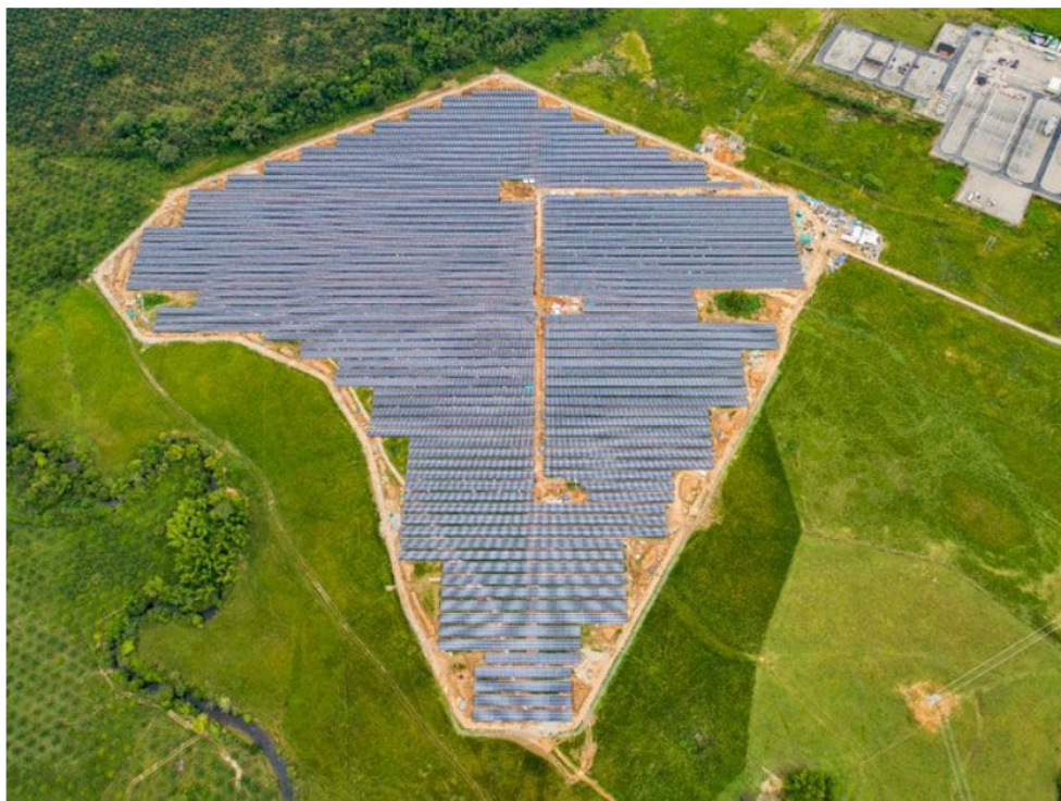
Parque Solar Castilla de Ecopetrol

Motivado por un discurso ambientalista, Petro ha llegado a imponer nuevas reglas a un sector en recuperación y en el que Ecopetrol brilla con luz propia. En 2021, gracias a una apuesta por diversificar sus negocios, una estricta disciplina de capital y un mejor ambiente de precios, la compañía logró utilidades de $16,7 billones, las más altas en su historia. De manera sorpresiva, tan solo seis meses después, registró una ganancia neta de $17 billones, con ingresos por $76 billones.