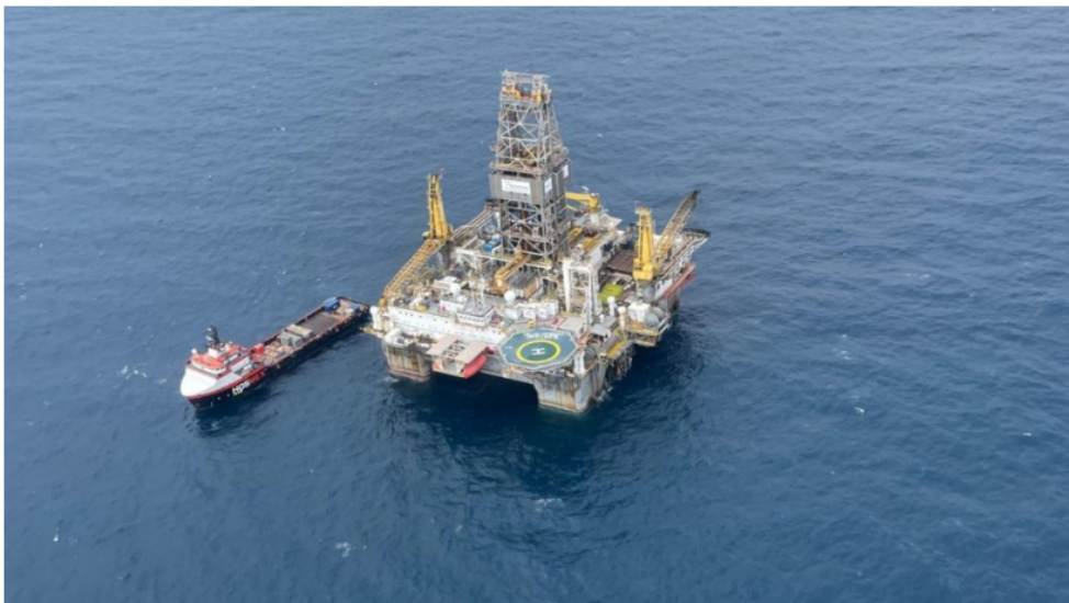
Pozo offshore de Ecopetrol en el mar Caribe colombiano.