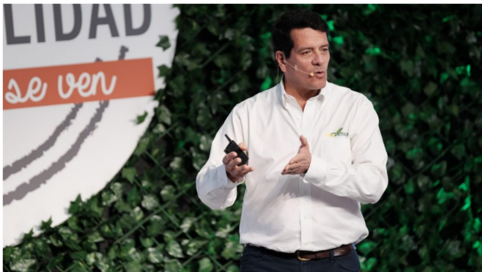
Felipe Bayón, presidente de Ecopetrol , ha reiterado que uno de los mejores negocios que tiene la compañía es el

Desde 2019, la firma ha realizado fracking en Estados Unidos, una experiencia que le ha permitido conocer aún más sobre no convencionales y la cual le ha aportado alrededor de 60.000 barriles de petróleo equivalente a través de la perforación de más de 100 pozos al año. Según ha dicho Bayón, hoy el negocio más rentable que tiene la compañía es el fracking en Estados Unidos, pues el margen Ebitda es de más del 85% y desde que arrancaron la operación se ha generado un Ebitda de casi US$400 millones.