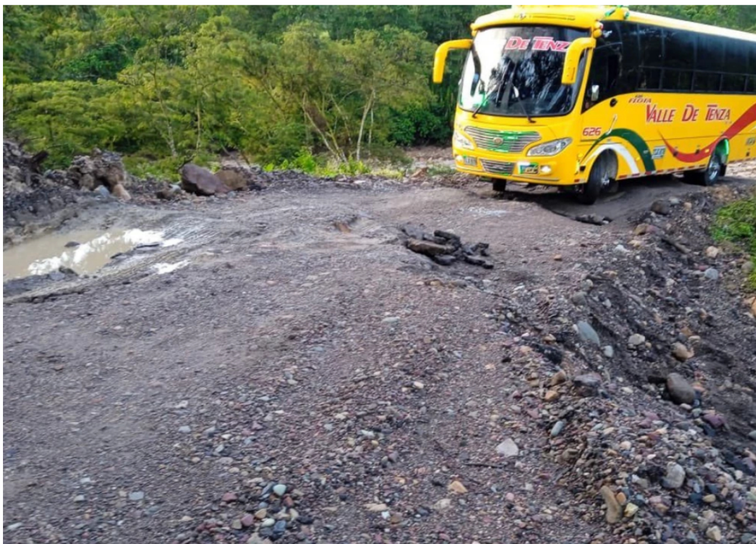
Deterioro de vía en la región de El Guavio