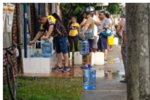
Barrancabermeja está sin agua y protestas impedirían trabajos de reconexión

4. Por otra parte, revisamos el panfleto que circula en el distrito donde son amenazados algunos líderes sociales; frente a este se establecen medidas tales como: generar reunión con el director nacional de la UNP para fortalecer el área administrativa y así activar la ruta de protección de los líderes.