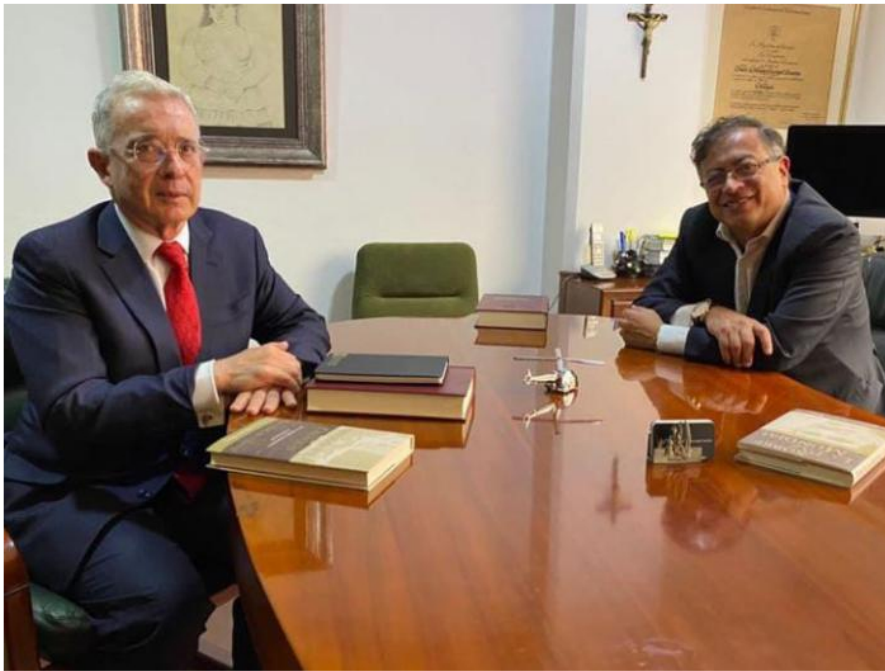
Álvaro Uribe y Gustavo Petro

Nuestra historia nacional contiene muchas anécdotas de elevados personajes que se comportaron con gallardía en las lides políticas. Manuel Murillo Toro, presidente en dos ocasiones, jefe del olimpo radical, conlleva varios de esos pequeños episodios. Al general José María Melo, el dictador, su paisano también chaparraluno, a quien había contribuido a derrocar, le pagó, mediante la adquisición de un crédito, la fianza de $8.000 que se le había impuesto después de haber sido juzgado. A don Carlos Holguín, jefe conservador, que le neutralizó a Murillo un enroque importante, se lo encontró en una de las calles de Bogotá, y en vez de recriminarlo lo abrazó, lo felicitó y le dijo: "esta parada si me la ganó usted" .