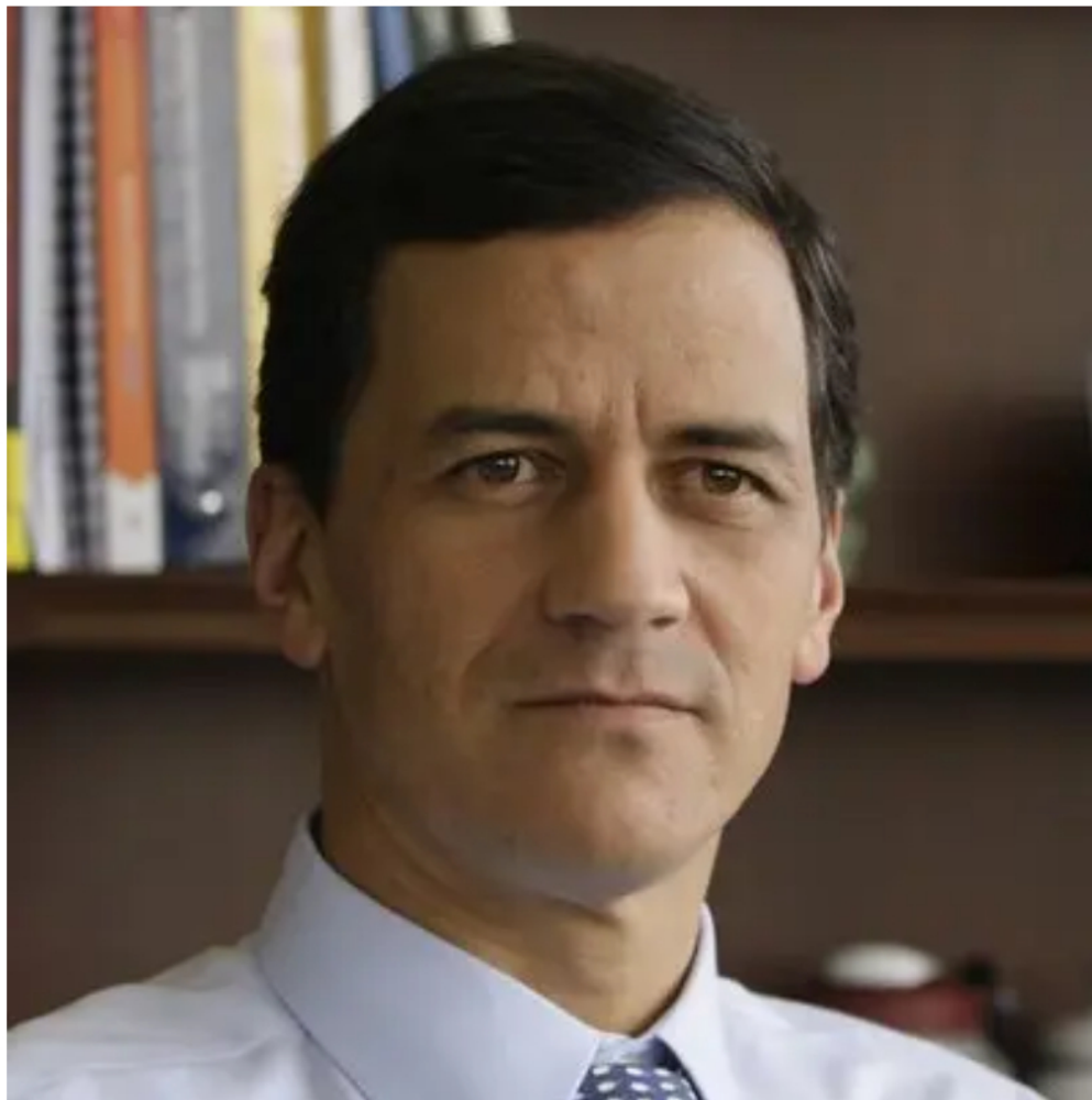
Por Rafael Nieto Loaiza

No hay asunto económico más importante que la reforma tributaria. Es fundamental para el futuro del país, para el