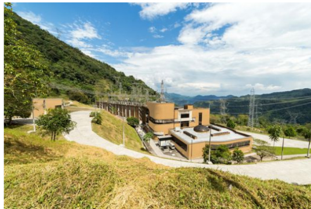
Aún no se logran los acuerdos necesarios para levantar los bloqueos.