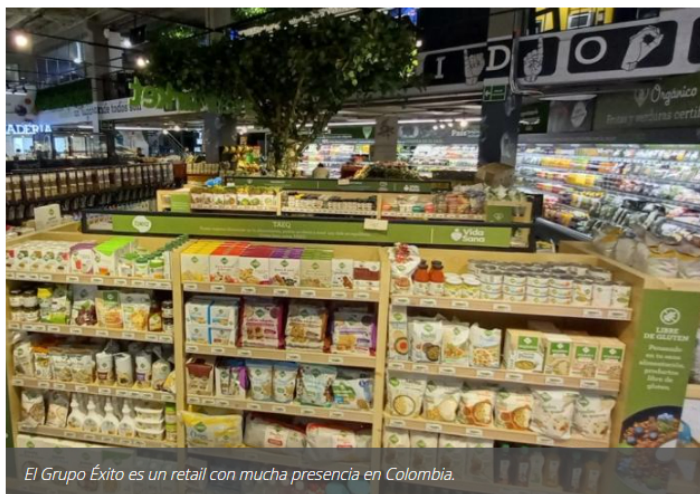
El Grupo Éxito es un retail con mucha presencia en Colombia.

La junta directiva le dio el visto bueno a la administración del Grupo para llevar a cabo esta tarea.