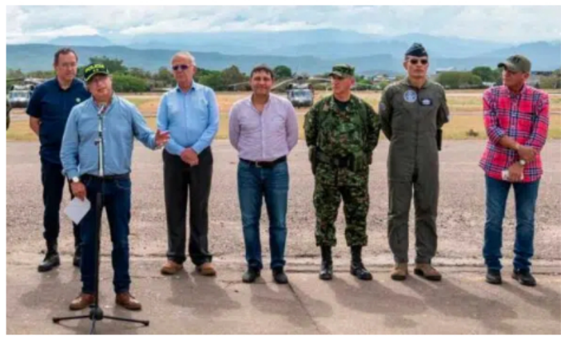
Petro culpa a Duque por la situación de orden público que vive el país