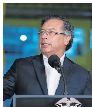
Presidencia de la República

El presidente de Colombia, Gustavo Petro Urrego , cuestionó el alza de las tarifas de facturas eléctricas.