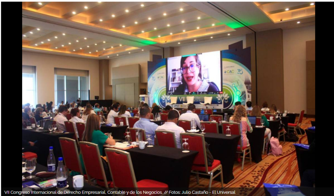
VII Congreso Internacional de Derecho Empresarial, Contable y de los Negocios. // Fotos: Julio Castaño - El Universal

El presidente de la Refinería de Cartagena participó en la primera jornada del Congreso Internacional de Derecho Empresarial, Contable y de los Negocios.