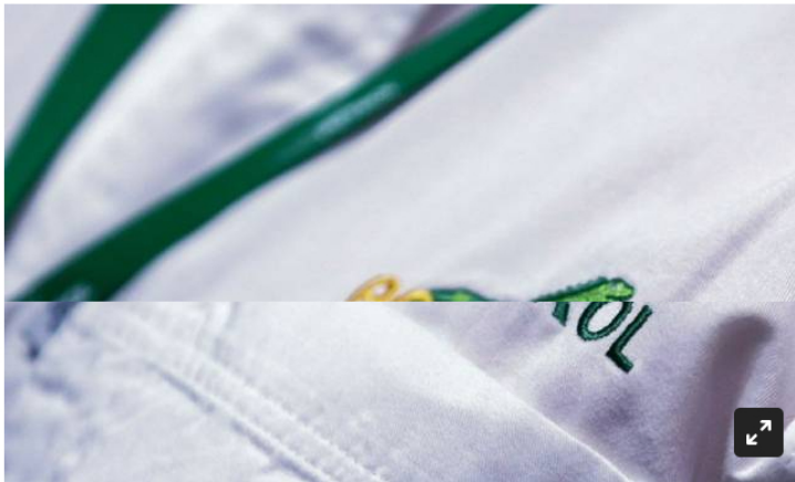
Trabajadores de Ecopetrol

Luego de los últimos mensajes enviados por el Gobierno, expertos analizan el presente de Ecopetrol .