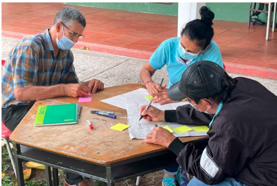
Fortalecimiento en las habilidades lectoescritoras

Por otro lado, Corpoeducación avanza en el acompañamiento a 21 instituciones educativas de Villavicencio , Acacias, Castilla La Nueva, Guamal, Cubarral, Puerto López y San Carlos de Guaroa para fortalecer los proyectos transversales sobre educación para la sexualidad, educación para la ciudadanía, medio ambiente y competencias socioemocionales.