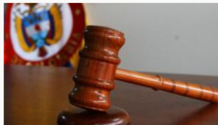
En libertad magistrado de Barranquilla acusado de abuso sexual con menor de edad