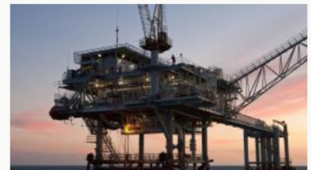
Gobierno Petro firmaría nuevos contratos de exploración petrolera