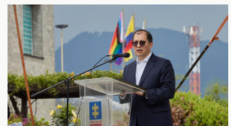
Fiscalía lanza primera guía para investigar delitos contra comunidad LGBTIQ+