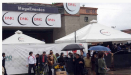
Niegan solicitud de remoción en caso DMG Grupo Holding