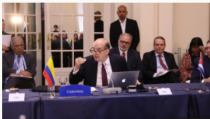
España y Chile serán países acompañantes en el proceso de paz