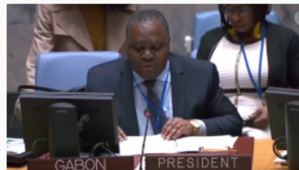
Misión de verificación de la ONU prorroga un año más su estancia en Colombia