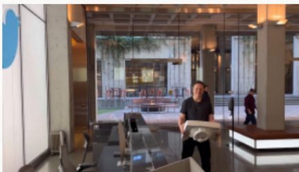
Elon Musk toma control total de Twitter