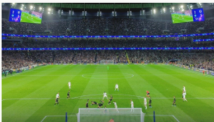
Los valores de los equipos en Champions