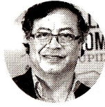
Gustavo Petro Urrego Presidente de Colombia

“La prohibición de deducir las regalías genera una renta ficticia que puede ahogar al sector minero en circunstancias de precios normales. Colombia sería el único donde las regalías no se pueden deducir”.