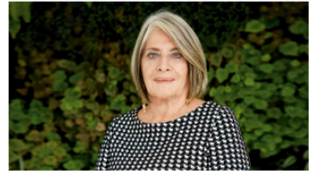
Siguen las renunciaciones en la Alcaldía de Cali: director de la Unidad de Bienes y Servicios anunció que deja el cargo