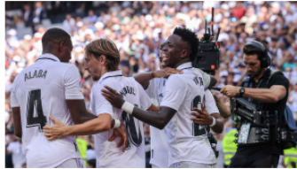
Real Madrid busca no aflojar en su marcha por Champions League ante Leipzig