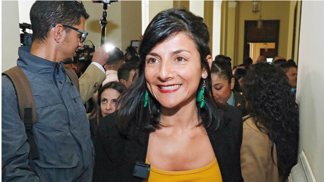
Irene Vélez ministra de Minas y Energía

En Vicky en Semana , la senadora María Fernanda Cabal dijo que hay “incompetentes en el poder” que nunca han generado riquezas. Lo anterior, haciendo referencia al presidente Gustavo Petro y a su gabinete ministerial, pero más exactamente a la ministra de Minas y Energía, Irene Vélez.