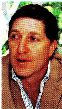
Saúl Kattan, economista.