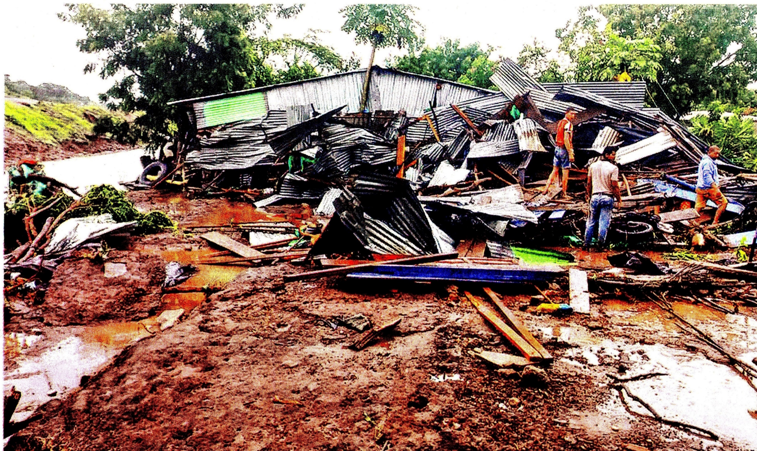
Cesar amaneció ayer con más de 20.000 damnificados. La destrucción tiene golpeada a buena parte de la población en la zona urbana del municipio de Bosconia (foto) por la ola invernal. En los corregimientos de Aguas Blancas y Mariangola persisten las inundaciones.

se acerca al millón, repartidas en 665 municipios. Hasta ayer, en las emergencias derivadas de las lluvias habían muerto 202 personas, más del doble que en el mismo lapso del año pasado. Y las comunicaciones también han sufrido mucho, debido a los daños de la infraestructura vial. Colombia / 1.2