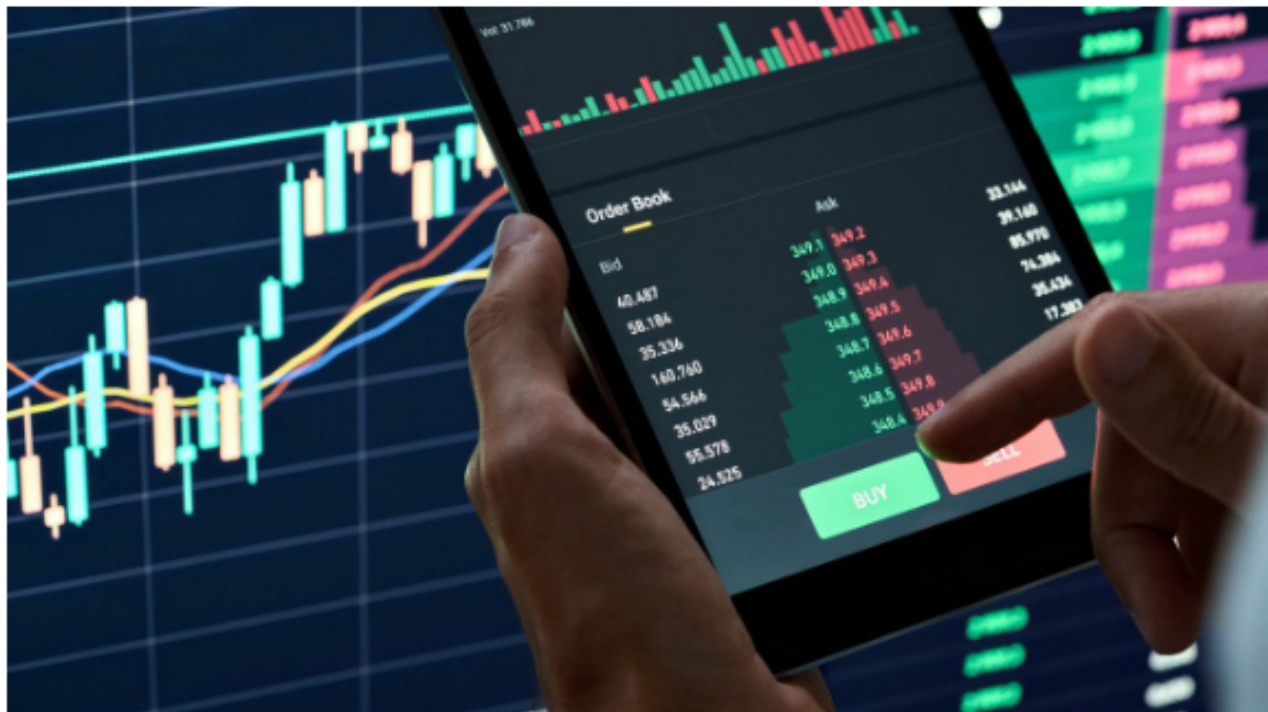
Esta ha sido una de las mejores semanas para la Bolsa de Valores de Colombia.

La Bolsa de Valores de Colombia (BVC) y Ecopetrol no ceden ante las presiones que azotan en este momento los mercados en todo el mundo, gracias a la inflación y la disparada del dólar, que tiene al peso nacional en su punto más bajo de la historia, y este jueves 20 de octubre volvieron a ubicarse en terreno positivo, impulsados principalmente por las acciones de Nutresa, que amanecieron con una fuerte alza, en medio de la expectativa que hay entre los inversionistas por las OPA para esta firma.