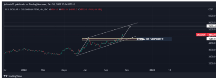
Gráfico del dólar frente al peso colombiano en temporalidad diaria

Las variables son a favor del dólar por la parte política en Colombia que no genera un entorno de confianza y un dólar que se ve favorecido a nivel mundial por subidas de tipos de interés de la Fed, desde la perspectiva estructural el precio está en tendencia alcista desde hace varios años y podría formar un impulso parecido a los dos anteriores que se observan en los últimos años en la gráfica y buscar la zona de los 5.379 COP.