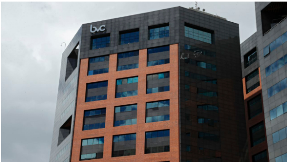
Esta ha sido una buena semana para la Bolsa de Valores de Colombia.

La Bolsa de Valores de Colombia y Ecopetrol siguen luchando por mantenerse a flote en medio de la crisis económica que azota al mundo y por lo menos lo están logrando este miércoles -19 de octubre- luego de que abrieran en verde, al igual que la mayoría de los indicadores de este mercado de valores, pese a las presiones del dólar, que nuevamente alcanzó máximos históricos.