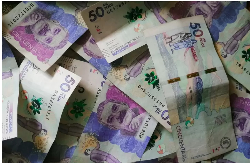
Reforma tributaria de Petro: Lista de los alimentos que subirían de precio