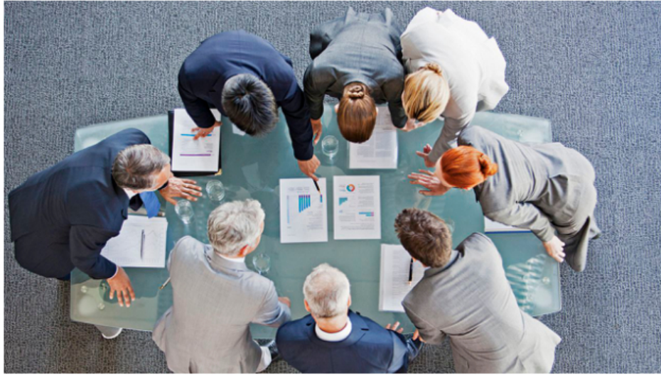
La atención que se está poniendo en las juntas de entidades públicas y Cámaras de Comercio evidencian su real protagonismo.

Aunque los integrantes de juntas directivas duran años ocupando los asientos de los órganos más poderosos en las organizaciones son los presidentes los que ponen la cara.