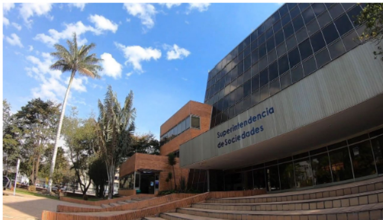
Superintendencia de Sociedades

Entre tanto, en las directivas de las cámaras de comercio, donde tienen asiento representantes del presidente, también vienen movimientos, que empiezan a ser conectados con el cambio de Gobierno.