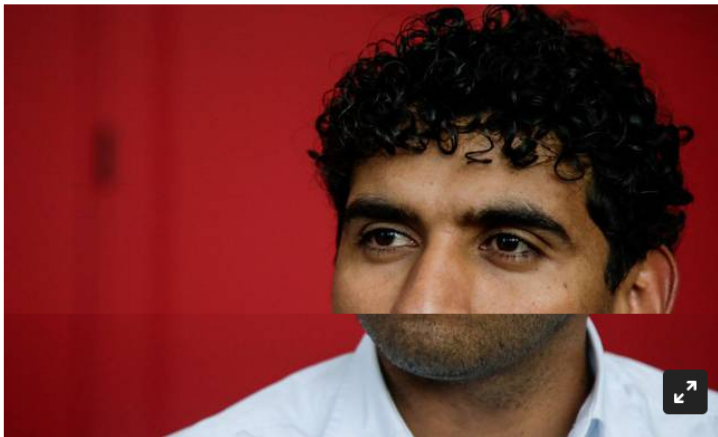
David Racero.

El presidente de la Cámara de Representantes, David Racero, dijo que el sector petrolero "debe aportar un poco más".