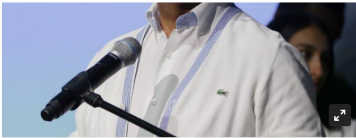
Presidente de Colombia, Gustavo Petro.