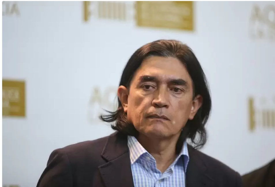
Gustavo Bolívar, senador de la República