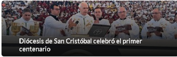
Diócesis de San Cristóbal celebró el primer centenario