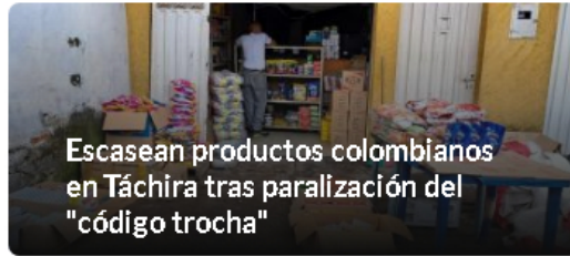
Escasean productos colombianos en Táchira tras paralización del "código trocha"