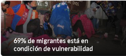
69% de migrantes está en condición de vulnerabilidad