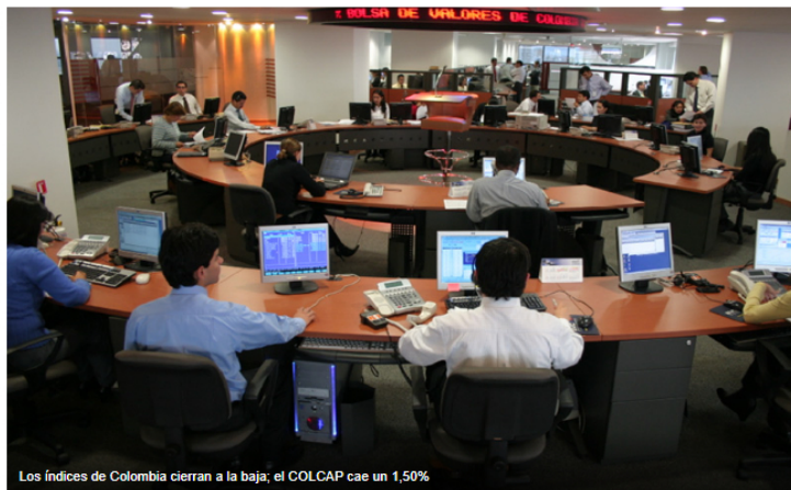
Los índices de Colombia cierran a la baja; el COLCAP cae un 1,50%