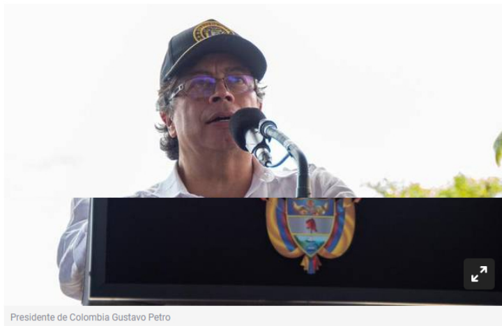
Presidente de Colombia Gustavo Petro

El presidente Gustavo Petro, puso sobre la mesa la idea de que La Guajira se convierta en generador de energías limpias de la mano de Ecopetrol .