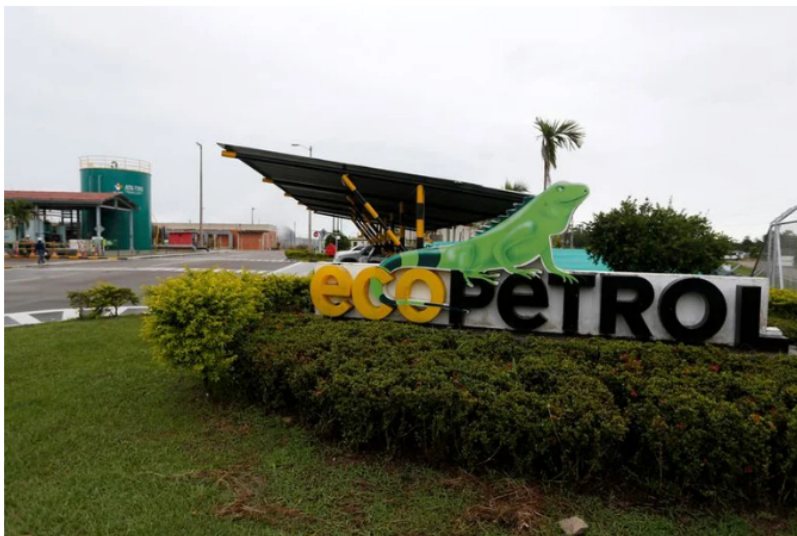
Foto de archivo. Imagen de la entrada a los campos de producción de Ecopetrol en Castilla La Nueva, departamento del Meta, Colombia.

Ecopetrol anunció que, el próximo lunes 24 de octubre , adelantarán una asamblea extraordinaria para elegir a los nuevos miembros de la junta directiva de la petrolera . El encuentro está convocado para realizarse a las 8:00 de la mañana en Corferias, Bogotá .