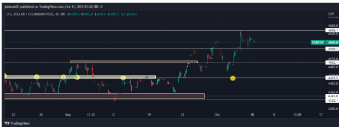
Gráfico del dólar frente al peso colombiano en temporalidad de 45 minutos

El riesgo no está favoreciendo para nada al país cafetero, normalmente el peso colombiano se correlaciona con los precios del petróleo y hay muchas más variables que tienen un peso en el precio de la moneda colombiana, la parte política y los riesgos a nivel mundial, Colombia depende en gran parte de las materias primas y del entorno global de la economía, la cual crece muy bien cuando las economías más grandes demandan materias primas, pero ahora con una recesión global que se viene encima el peso colombiano pierde gran atractivo, aun cuando el Banco de La Republica sube los tipos de interés en el 10%, el precio del dólar americano frente al peso colombiano en la sesión de hoy se ubica en la zona de los 4,610 COP, lo que representa una bajada de -10 COP y una variación de -0.22%.