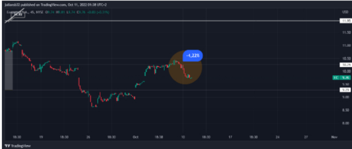
Gráfico de la acción de Ecopetrol en temporalidad de 45 minutos

Ecopetrol se hunde en la bolsa de Nueva York 0,44 USD lo que representa una variación negativa de 4,31% y la acción se ubica en la zona de los 9,77 USD