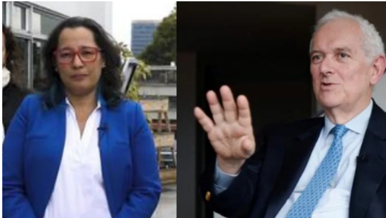
Ante las afirmaciones de que no habrá más explotaciones, Hacienda informa que nada está definido.

Para nadie es un secreto la crisis energética que atraviesa Europa por la guerra entre Rusia y Ucrania, pues este conflicto impidió la exportación de gas que sale de Rusia para proveer al 40 % de Europa. Situación que afecta indirectamente al mundo y que ha obligado a los gobiernos a cambiar sus políticas internas mineras .