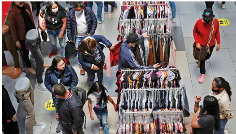
Es a penas obvio que en una recesión el consumidor se apriete el cinturón y no gaste. Así el recaudo cae, como ocurrió en la pandemia.

Los fondos de inversión están en alerta y los mensajes de un ministro como Ocampo, respetado a nivel internacional, no han logrado calmar los ánimos. De hecho, intervenciones del presidente Petro, como la de esta semana, preocuparon a tal punto que Ocampo tuvo que salir a apagar el incendio. “El Gobierno no va a proponer control de cambios ni va a imponer impuestos a los egresos de capital (...) No hay ningún temor para estos inversionistas. Más aún, celebramos que los capitales extranjeros estén entrando al país”, dijo el ministro.