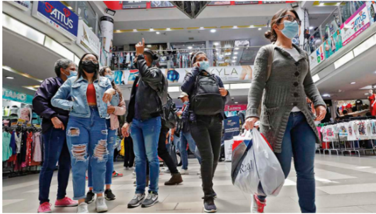
El año frente a la desoctración económica se tró evidente. El Emisor ajustó sus proyecciones y estima para 2023 un crecimiento cercano a 0 por ciento. Las inversiones en la industria extractiva se resentirán.

excesivo se incrementa aún más el costo de vida, lo cual llevaría al Banco de la República a seguir aumentando las tasas de interés, que, a su vez, golpearían al consumidor, las empresas y la generación de empleo.