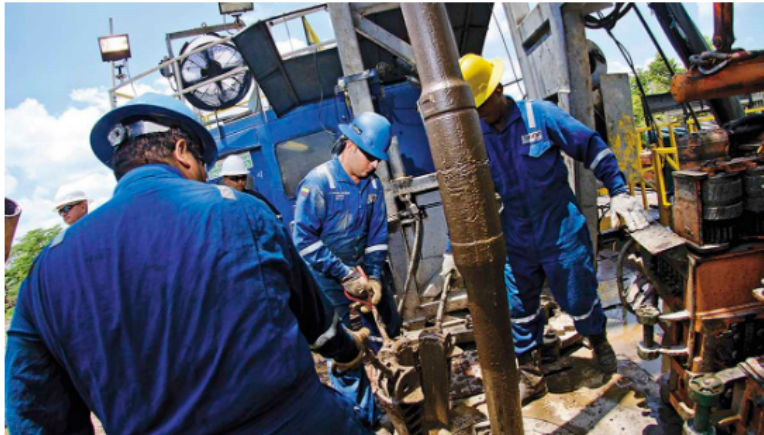
Cientos de miles de familias viven de la industria petrolera.

Ahí se encienden unas alarmas. Lo importante en este paso del Gobierno Petro, y que aún no está claro, es cómo reemplazarán en el mediano plazo los billones que le entran al Estado (34 billones por concepto de impuestos y regalías, según la ACP) si las industrias petrolera y carbonífera se debilitan y desaparecen más rápido de lo conveniente. Aunque estos impuestos pueden llevar a un mayor recaudo en el corto plazo, impactarán las decisiones de inversión de estas compañías, lo cual podría afectar la generación de recursos a mediano y largo plazo.