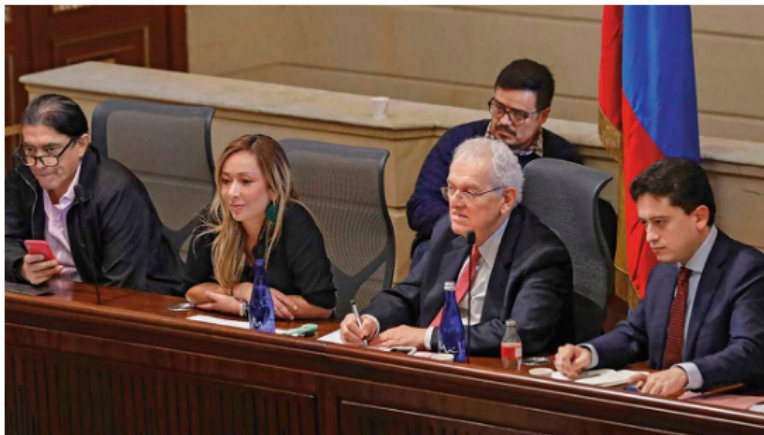
El ministro de Hacienda, José Antonio Ocampo, lidera la propuesta de reforma tributaria.

Eso sí, Petro está cumpliendo lo que prometió en campaña. Tras su primera gran victoria en el Congreso, el mandatario dijo que busca "avanzar hacia un modelo de desarrollo sostenible y crear un sistema justo de tributación, donde los que más tienen sean los que más tributen". Una frase similar a la que repitió en los meses pasados en diferentes plazas públicas y debates.