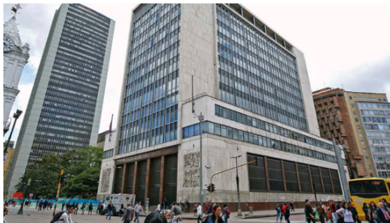
En menos de un año, el Banco de la República aumentó las tasas de interés de 1,5 a 10 por ciento, buscando atajar una inflación desbordada.

El pronóstico es de un crecimiento de solo el 0,7 por ciento. Aunque hay metas de recaudo optimistas, existen múltiples amenazas, y no propiamente locales, que pueden llevar a que los recursos que se esperan por la reforma tributaria se pierdan debido a un freno en la actividad económica. Es apenas obvio que en una recesión el consumidor se apriete el cinturón y no gaste. Así el recaudo cae, como ocurrió en la pandemia.