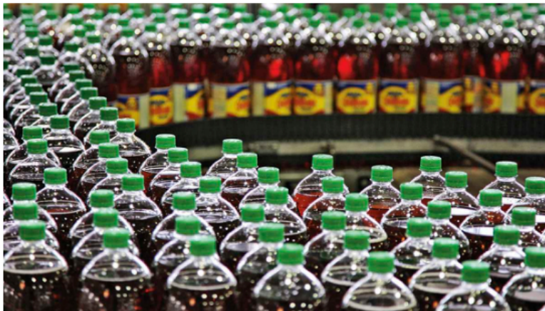
Se espera que la reforma de Petro empareje el recaudo por impuestos, como porcentaje del PIB, con el que tienen países de América Latina: cerca del 21 por ciento.

Hoy Colombia es un país que recauda en materia de impuestos el 18 por ciento de su PIB, mientras que el promedio de las naciones de la Oede llega al 33,1 por ciento. Por eso, se espera que la reforma de Petro empareje el recaudo por impuestos, como porcentaje del PIB, con el que tienen países de América Latina: cerca del 21 por ciento.