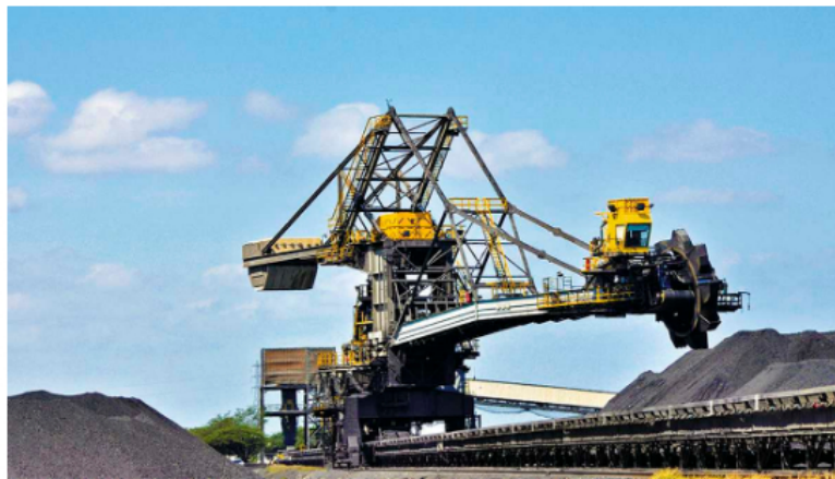
La gran preocupación es que si las empresas se de bilkan, inevitablemente, se perderían empleos y esto afectaría a la clase trabajadora.

También, las pensiones de más de 13 millones de pesos serán gravadas (impactará al 0,2 por ciento de dicha población) y se aprobaron sobretasas de 3 puntos para las hidroeléctricas y de 5 puntos para el sistema financiero. En renta, en personas naturales, el sacrificio para los que ganan más será en total de 3,5 billones de pesos. Apretarse el cinturón.