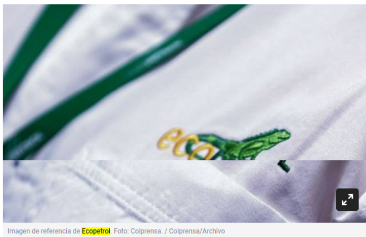
Imagen de referencia de Ecopetrol .

La convocatoria la hizo el mismo presidente de la petrolera, Felipe Bayón.