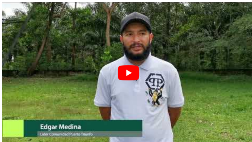
En su compromiso por impulsar el comercio local de bienes y servicios, entre enero y agosto de 2022, Ecopetrol y sus empresas contratistas contrataron $662 mil millones con firmas...