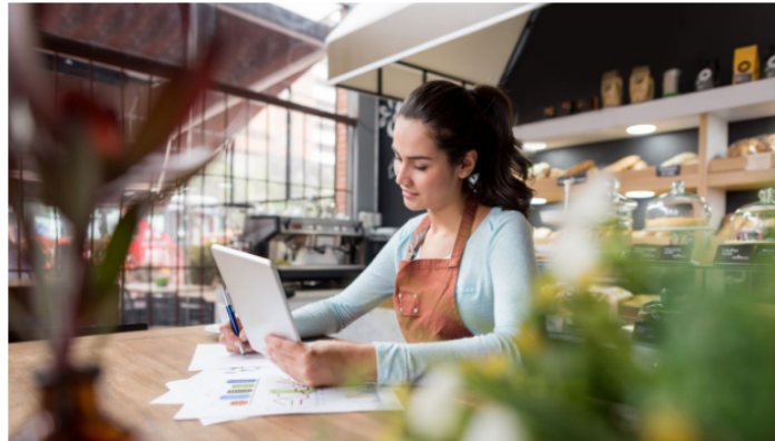
Los procesos de producción son más baratos, más ágiles, rápidos y actuales si incorporamos tecnología.