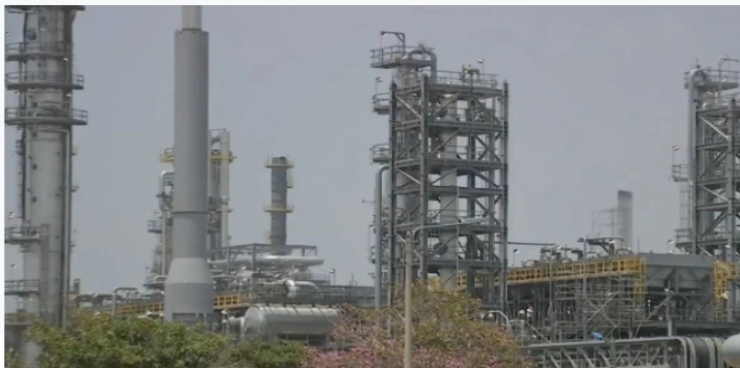
Reforma tributaria: alerta sectores gas, minas y petróleo.

Los diferentes gremios han expresado que la sobretasa impactará directamente en los bolsillos de los colombianos.