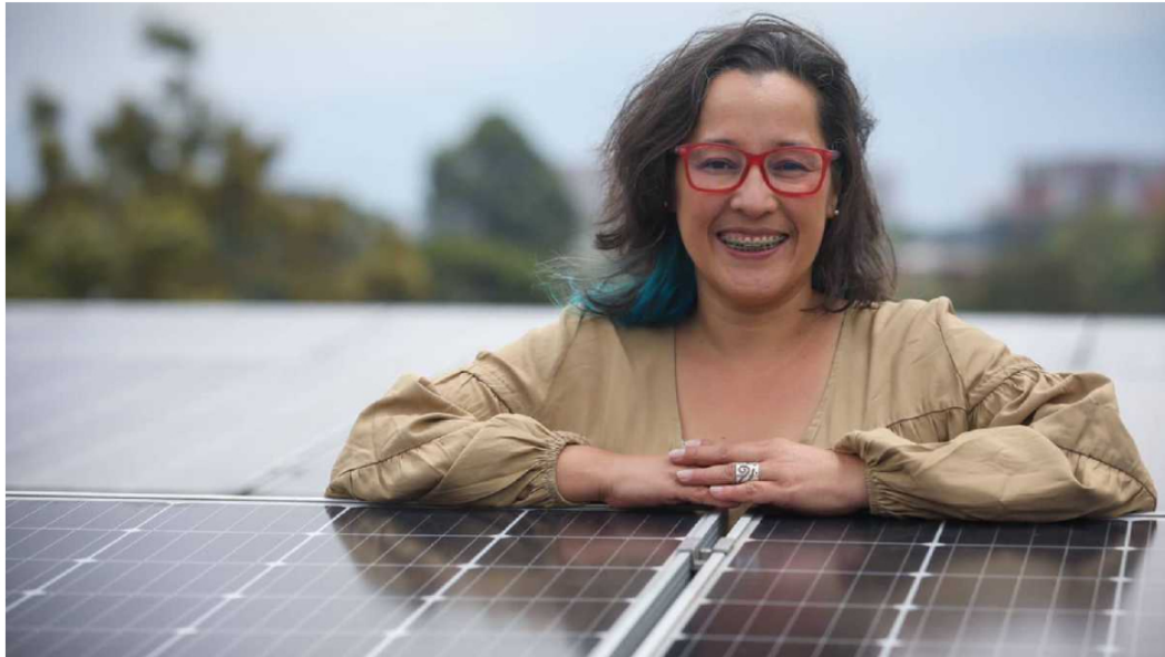
La viceministra aseguró que la importación de gas desde Venezuela es una opción para Colombia.

Promigas presentó un nuevo informe del sector de gas natural a través del cual dejó en evidencia que Colombia tiene un gran potencial para aumentar sus reservas hasta entre 35 y 50 años, siempre y cuando, se puedan desarrollar varios proyectos que tienen planeados las compañías del sector.