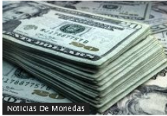
Noticias De Monedas

Dólar se apreció entre cinco de las seis monedas fuertes de América Latina en septiembre