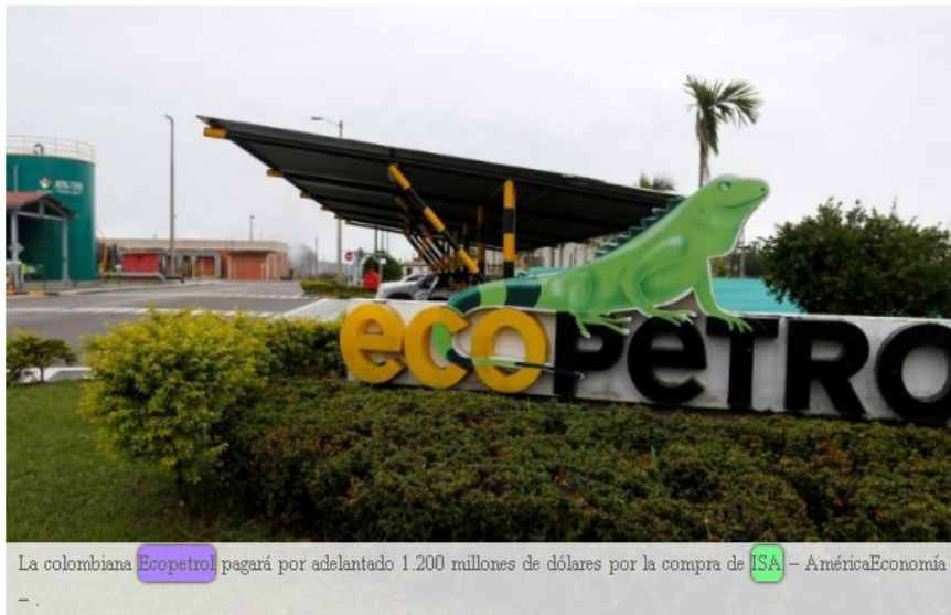
La colombiana Ecopetrol pagará por adelantado 1.200 millones de dólares por la compra de ISA – AméricaEconomía – .

La empresa pública colombiana de energía, Ecopetrol , anunció este jueves que cancelará anticipadamente 1.200 millones de dólares de un préstamo que contrajo en agosto pasado con un grupo de bancos internacionales, para la compra de la empresa de electricidad ISA .