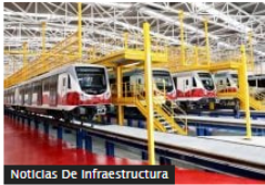
Noticias De Infraestructura

Metro de Medellín suscribió el contrato para operar el Metro de Quito