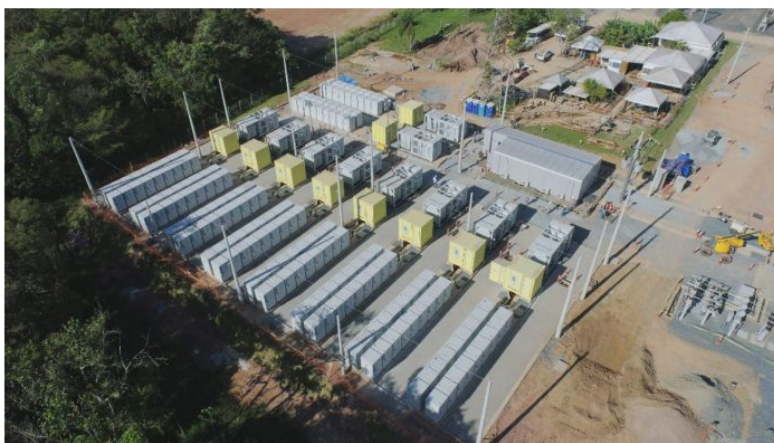
ISA Cteep Brasil almacenamiento con baterías.

ISA Cteep, filial de Interconexión Eléctrica (ISA), dedicada al sector de transmisión de energía en Brasil, inició operaciones del primer proyecto de almacenamiento de energía en baterías a gran escala en el sistema de transmisión brasileño.