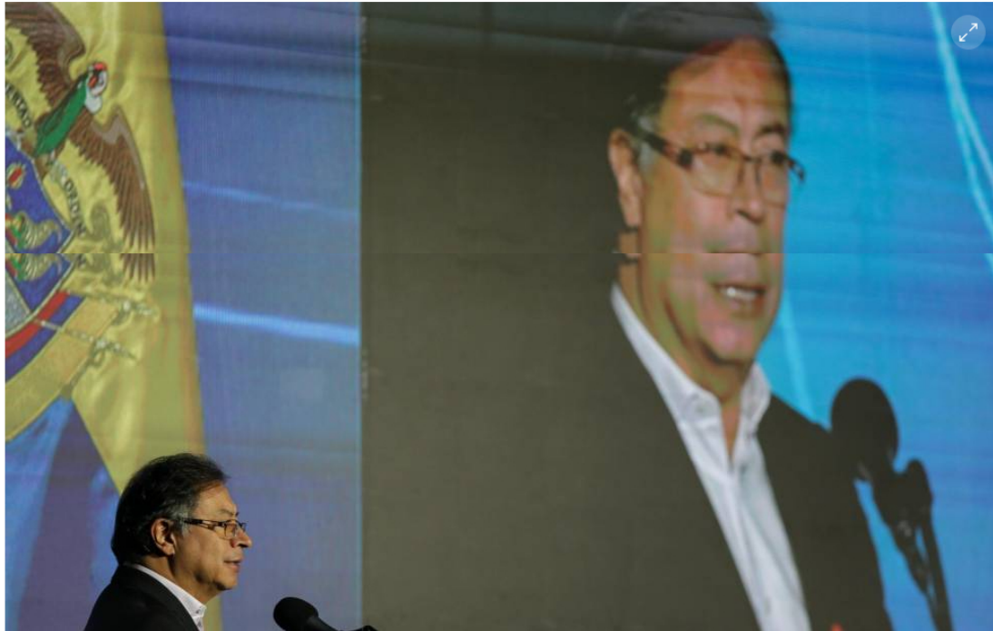
Gustavo Petro, presidente de Colombia.