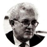
José Antonio Ocampo

"La ciudadanía y los entes de control deben estar muy atentos a lo que ocurre en los Ocad, que son los órganos que deciden en qué proyectos se gasta el dinero de las regalías".