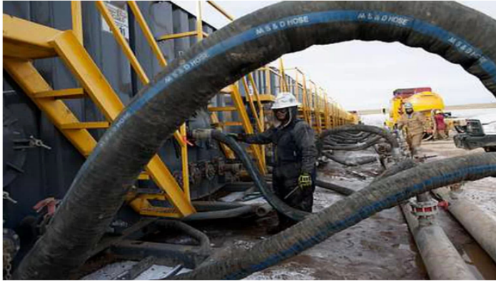
En EE. UU. -Dakota del Norte, en la imagen-, el «fracking» ha reducido la dependencia energética. a. cullen

El izquierdista Gustavo Petro cumple así su promesa de campaña